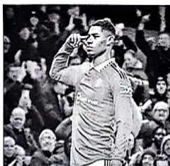
Marcus Rashford es actual jugador del Manchester United. A continuación

El Barcelona y el Manchester United están a punto de cerrar el acuerdo para la cesión del delantero británico Marcus Rashford al club español para la próxima temporada.