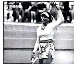
Venus Williams se enfrenta previo a su participación en el DC Open de Washington (WTA 500).

La menor de las Williams regresa a las pistas, 16 meses de inactividad con partido de primera ronda contra Payton Stearns, según el sorteo celebrado ayer.