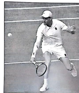
Jannik Sinner, durante la final en el torneo de Wimbledon, donde ganó su primer título en Gran Bretaña. (I)

Alcaraz, que tiene el tope en Canadá en los cuartos de final de hace dos temporadas, tiene la posibilidad de recortar puntos en la clasificación mundial a Sinner. El murciano no jugó el pasado curso este torneo, por lo que no defiende nada en la presente edición. Sinner llegó a cuartos de final en 2024. (EFE)(D)