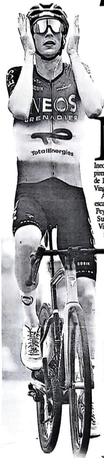
Thymen Arensman, cruza la meta y celebra su histórico triunfo en la etapa 14 del Tour de Francia.

EL CICLISTA neerlandés ganó la etapa reina pirenaica disputada entre Pau y Superbagnères, de 182,6 km.